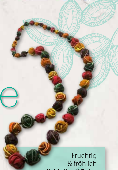
Fruchtig & fröhlich Halskette mit Perlen aus Orangenschalen, ca. 58 Euro, über Green-age.de

Oft greifen wir nach den großen Dingen – sie sind es, die uns vielversprechend erscheinen. Dabei sind es die vielen wunderschönen Kleinigkeiten, die im Ganzen etwas Großartiges vollbringen und unser Leben bereichern.