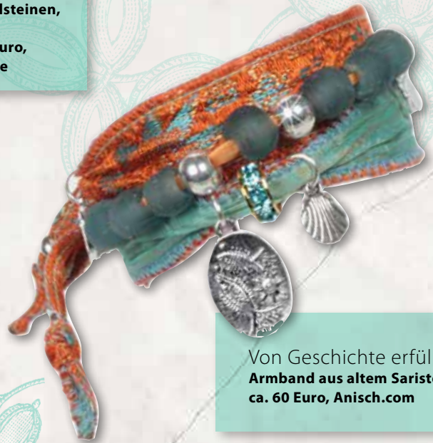
Von Geschichte erfüllt Armband aus altem Saristoff, ca. 60 Euro, Anisch.com