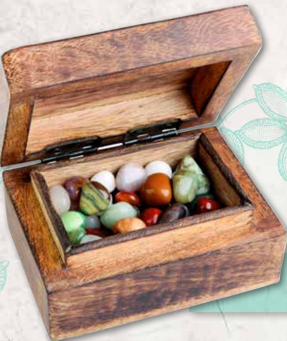
Platz für Kostbarkeiten Kästchen aus Mangoholz, ca. 5 Euro, über Pranahaus.de