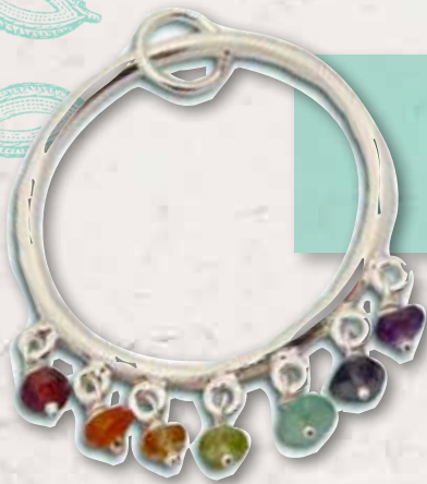
Bedeutungsvoll Anhänger mit Halbedelsteinen, die die sieben Chakren symbolisieren, ca. 29 Euro, über Shantiboutique.de